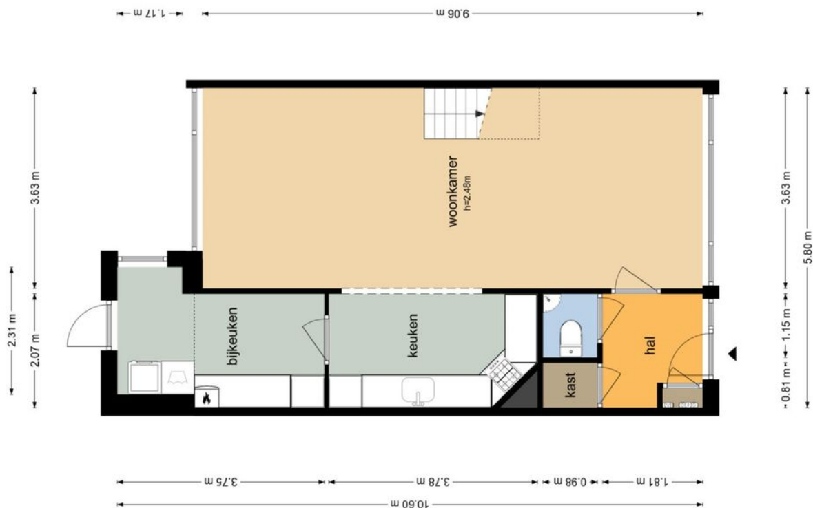
Aak 145 - Wieringerwerf Begane Grond